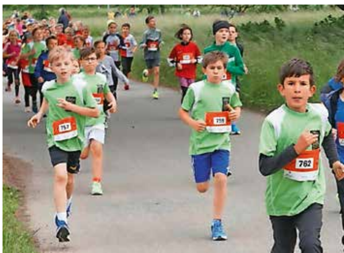
Die U10/12 auf der Strecke