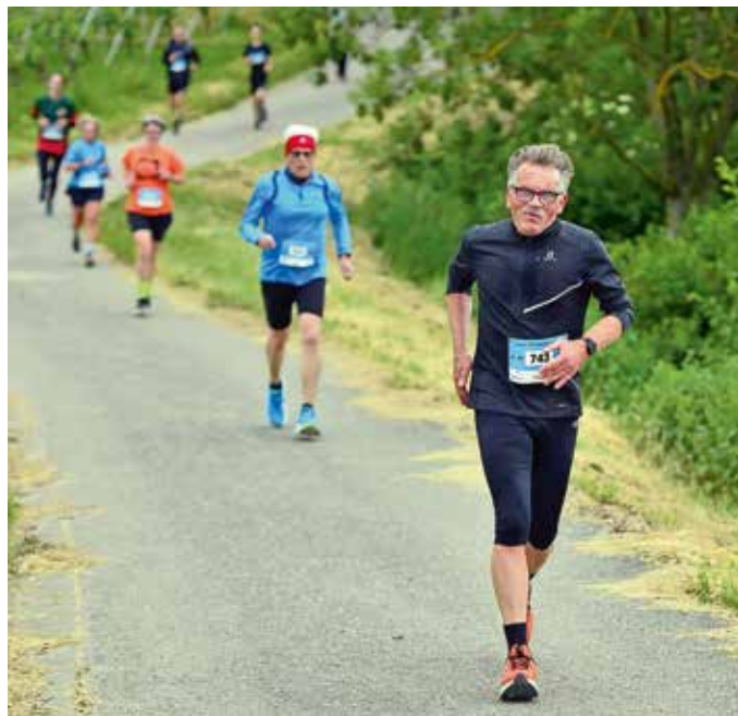
Die zwei Britzinger Lauftreffoldies auf dem Weg ins Ziel