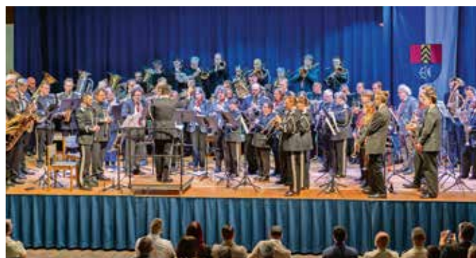
Überzeugten mit ihrer souveränen Darbietung: Die Bergmannskapelle Buggingen, die Stadtmusik Müllheim und die Militärmusik aus Metz.