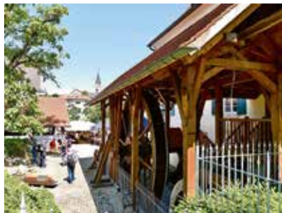
Deutscher Mühlentag

Die Helfer des Arbeitskreises Frick-Mühle bereiten sich eifrig auf den deutschen Mühlentag am Pfingstmontag 25. Mai vor. An diesem Tag ist an und in der Frick-Mühle den ganzen Tag Festbetrieb, der mit einem ökumenischen Gottesdienst um 10.30 Uhr startet. Daran anschließend ab 11.30 Uhr kann die Mühle besichtigt werden, das Mühlrad dreht sich immer wieder und Korn wird zu Mehl gemahlen. Für Kinder gibt es Angebote an Handmühlen, selbst Mehl herzustellen und mit alten Waagen abzuwiegen. Am Nachmittag ab 15.00 Uhr wird das Kasperle auftreten. Zwischen 13.00 und 14.30 Uhr spielt die Jagdhornbläsergruppe Markgräflerland auf.