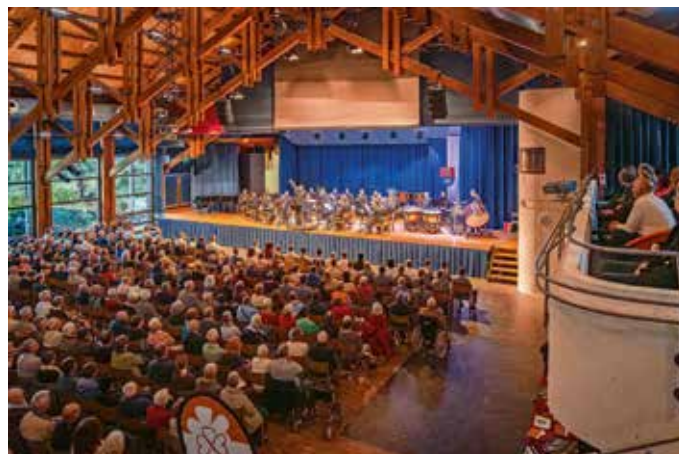
über 500 Gäste waren der Einladung zum Benefizkonzert der Deutsch-Französischen Brigade ins Müllheimer Bürgerhaus gefolgt.

wundervolle Veranstaltung ermöglicht haben: Den musikalischen Ensembles, dem Bürgermeister der Stadt Müllheim i.M. und allen Mitarbeiterinnen und Mitarbeitern der Stadtverwaltung, des städtischen Bauhofs sowie dem Restaurant „EssKultur“.