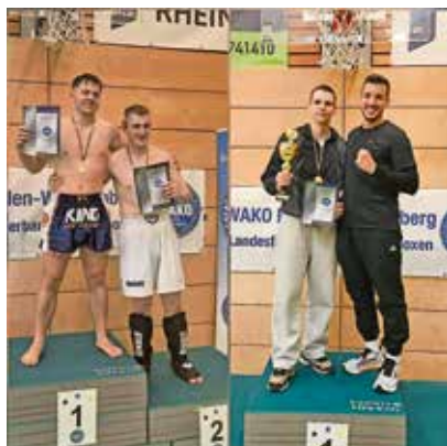
Dreiländereck-Pokal 2025 in Müllheim

Weitere Informationen, auch zu den Trainingszeiten, auf www.tammazla.de .