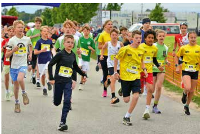
Start der Jugend U14/16

Auch die Erwachsenen zeigten sich in guter Form und erreichten im großen Starterfeld ebensogute Plätze und prima Laufzeiten: