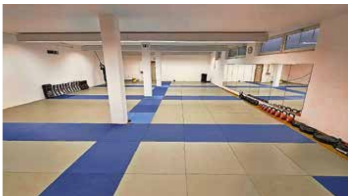
Ein Teil der Trainingsraum

Die Tammazla Kampfkunstschule e.V. in Müllheim sucht Untermieter für ihre Sporthalle. Die Halle ist täglich bis 17.00 Uhr sowie am Wochenende (Samstag & Sonntag) ganztägig verfügbar.