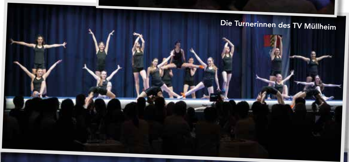
Die Turnerinnen des TV Müllheim