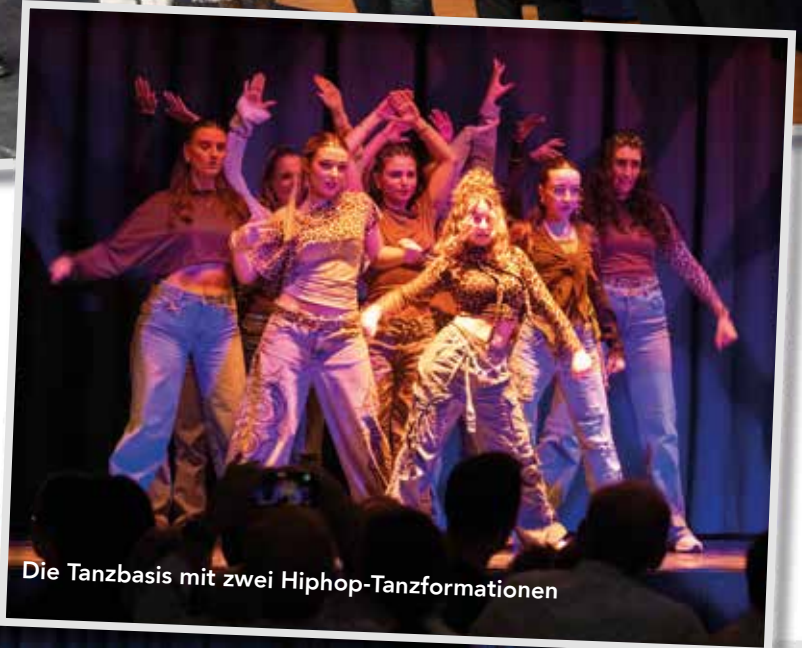
Die Tanzbasis mit zwei Hiphop-Tanzformationen