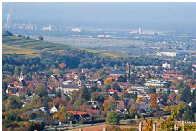
Das stetige Wachstum Müllheims stellt die Stadtkasse vor wachsende Herausforderungen.