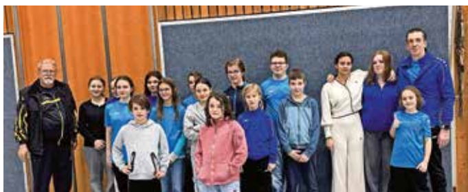
Mannschaft der SG Badenweiler-Neuenburg

Beim 52. Internationalen Pokalschwimmen des SSV Grenzach am 1. Februar 2026 präsentierte sich die SG Badenweiler-Neuenburg mit einem leistungsstarken Team. Insgesamt gingen 18 Athletinnen und Athleten an den Start und absolvierten 57 Einzel- und 8 Staffelfstarts. Der Wettkampf im Hallenbad Grenzach wurde mit internationaler Beteiligung ausgetragen und war mit insgesamt elf Vereinen aus Deutschland und der Schweiz stark besetzt.