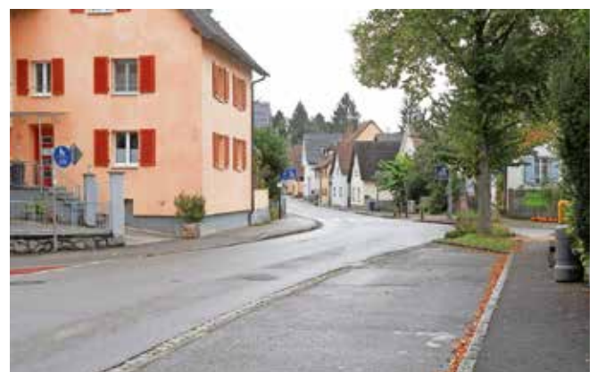
Vögisheim erhält während der Ortsdurchfahrt-Sanierung eine provisorische Wendeschleife für den Busverkehr.

Für die Fahrgäste ergeben sich dadurch zwar etwas längere Fußwege, diese werden jedoch gut beleuchtet und sicher gestaltet, um eine verlässliche und komfortable Nutzung des öffentlichen Nahverkehrs während der Bauzeit zu gewährleisten.