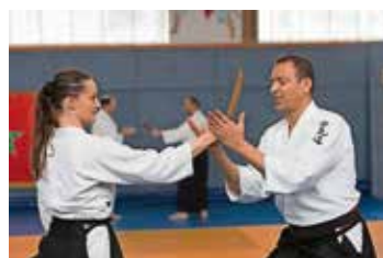
Abwehr gegen Messerangriff

Jeden Mittwoch findet von 19.00 bis 20.30 Uhr in der Kampfkunstschule Tammazla, Wilhelmstraße 19 A, Müllheim, ein Selbstverteidigungskurs für Frauen ab 14 Jahren statt. Neben Kampfsporttechniken aus Jiu-Jitsu und Aikido lernen Sie hier auch vorbeugende Maßnahmen in Gefahrensituationen, Deeskalation und Mut zur Zivilcourage.