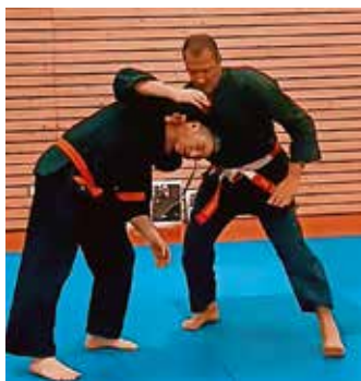
Jiu Jitsu-Würgetechnik