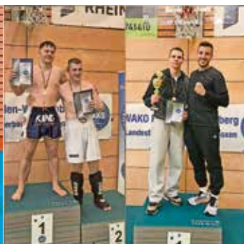
Dreiländereck- Pokal 2025 in Müllheim

Jeden Mittwoch findet von 19.00 bis 20.30 Uhr in der Kampfkunstschule Tammazla, Wilhelmstraße 19 A, Müllheim, ein Selbstverteidigungskurs für Frauen ab 14 Jahren statt. Neben Kampfsporttechniken aus Jiu-Jitsu und Aikido lernen Sie hier auch vorbeugende Maßnahmen in Gefahrensituationen, Deeskalation und Mut zur Zivilcourage.