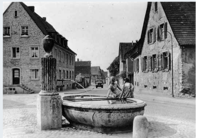
Blick vom Löffelbrunnen um 1942 in die Müllheimer Hauptstraße, die 1938 in „Adolf-Hitler-Straße“ umbenannt worden war. Das Gebäude vorne links im Rohbau war 1940 zu Beginn des Zweiten Weltkriegs durch französischen Beschuss zerstört worden.