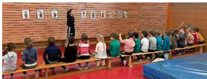
Selbstverteidigung: Theorieteil

Weitere Informationen unter www.tammazla.de