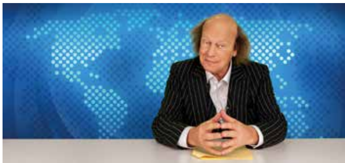
Arnulf Rating: tagesschauer

Hebel-Apotheke Werderstr. 31 D-79379 Müllheim Tel.: 0049 (0) 7631 / 22 53