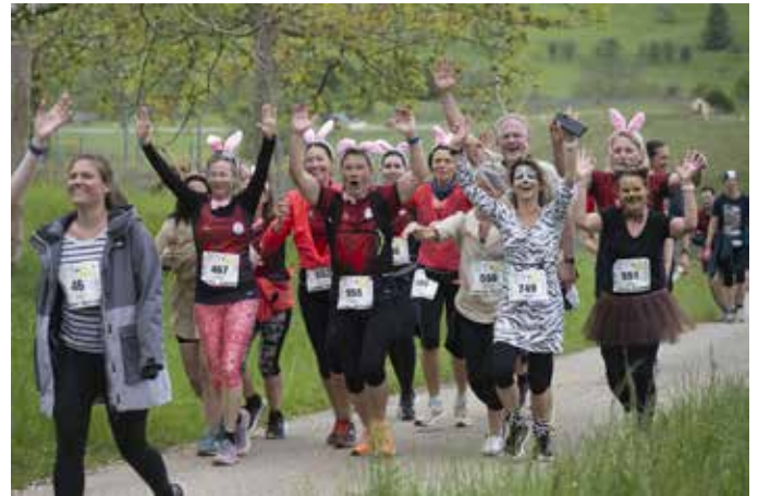
Genusslauf 2024 - wie immer viele verkleidete Lauffreunde