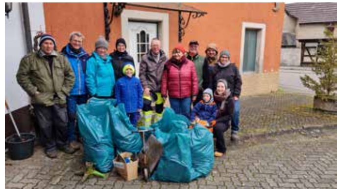
Die fleißigen Helfer und der gesammelte Müll

Das Wetter war leider nicht so gut, aber es hielt trotzdem einige „Unterstädtler“ nicht davon ab, die Unterstadt zu putzen. Es hat sich auch wieder gezeigt, dass doch einiges an Müll zu sammeln war. Nach der „Putzete“ traf man sich wieder beim Ausgangspunkt der Familie Hitschler in der Hauptstr. 6. Dort gab es dann die Belohnung für die fleißigen Müllsammler. Warme Getränke und Kuchen und dann noch leckere Bratwürste, die das GenerationenNetz und der „Kleine Hecht“ aus Neuenburg gespendet hatten, mit Brötchen, gespendet von der Hausbäckerei Kotz. Natürlich gab es auch noch entsprechende Getränke dazu. Bei gemütlicher Runde sprach man über die Unterstadt, was man noch machen könnte, z.B. noch einen Flohmarkt, und wie viel Spaß es macht, gemeinsam etwas für die Unterstadt zu tun. Ein großes Dankeschön an die großen und kleinen Helfer bei der „Putzete“.