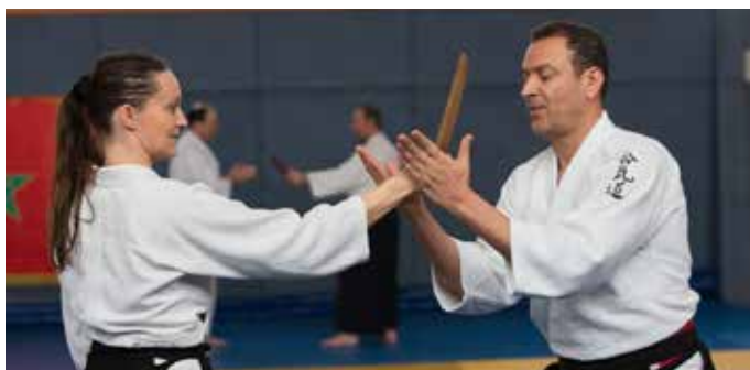
Abwehr gegen Messerangriff

Seit dem 25. September 2024 findet jeden Mittwoch von 19.00 bis 20.30 Uhr in der Kampfkunstschule Tammazla in der Wilhelmstraße 19A in Müllheim ein Selbstverteidigungskurs für Frauen ab 14 Jahren statt. Hier lernen Sie nicht nur Kampfsporttechniken aus Jiu-Jitsu, Aikido, sondern auch Wachsamkeit, vorbeugende Maßnahmen in Gefahrensituationen, Deeskalation und Mut zur Zivilcourage. Informationen und Anmeldung unter tammazla@gmx.de oder unter: 017684886947.