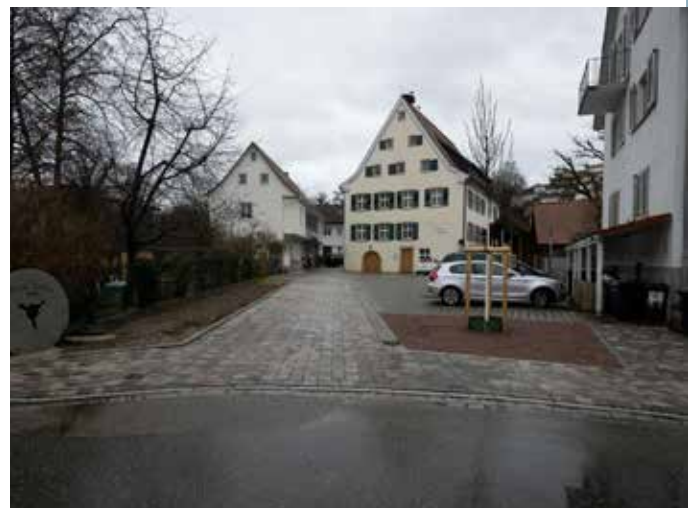
Der neugestaltete Vorplatz beim Mühlenmuseum Frick-Mühle.