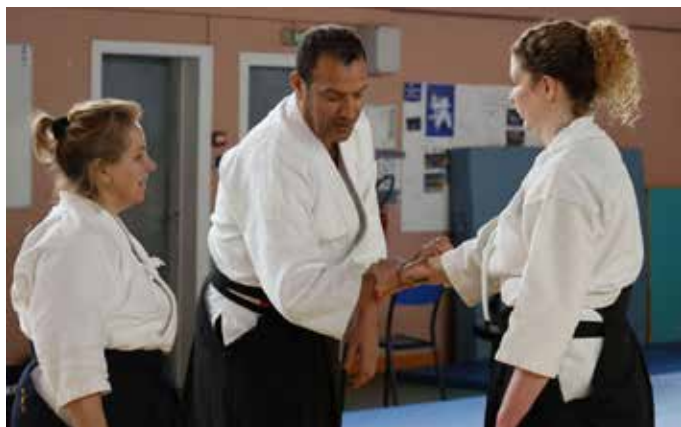
Nikkyu mit ein kurzer Stab, Foto: El Ouimi Hassan

Weitere Informationen, auch zu den Trainingszeiten, auf www.tammazla.de .