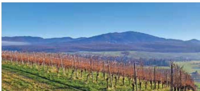
Wanderung durch die Reben um Müllheim und Umgebung

Info: Begrenzte Teilnehmerzahl. Einkehr am Ende der Tour ist geplant.