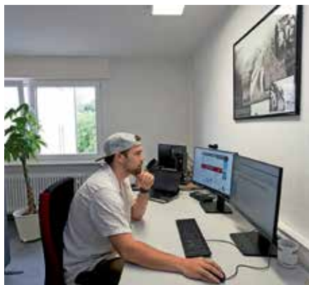
Die Feuerwehr Müllheim bietet ihren Einsatzkräften Coworking-Arbeitsplätze, um die Einsatzbereitschaft zu verbessern.