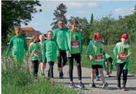
Nach dem Warmlaufen hochkonzentriert auf dem Weg zum Start.

Traditionell findet am Vorabend von Christi Himmelfahrt nun bereits seit sechs Jahren in Buggingen der Feierabendlauf, die dritte Laufveranstaltung für den Markgräfler Cup, statt.