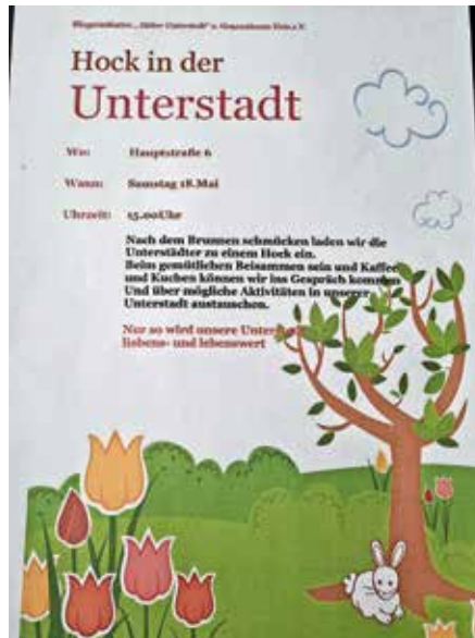
Hock zu Pfingsten, nach dem Brunnen schmücken, in der Unterstadt

Beim gemütlichen Beisammensein mit Kaffee und Kuchen können wir ins Gespräch kommen und uns über mögliche Aktivitäten in unserer Unterstadt austauschen.