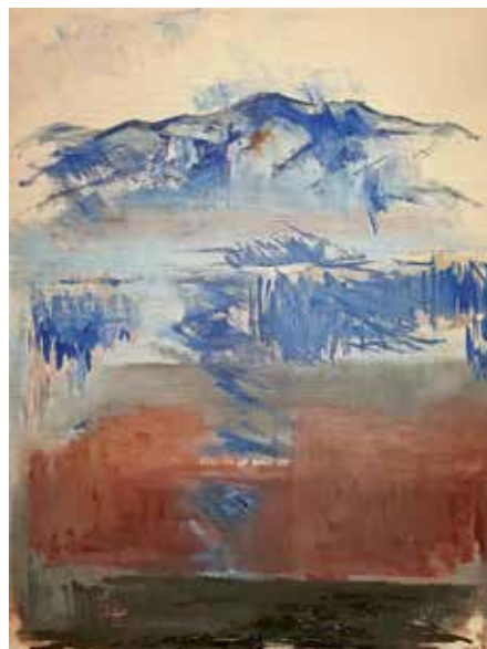
„Der Blauen“ von Hans-Günther van Look

Neues Führungsangebot des Markgräfler Museums Müllheim ab Mai zum „Jubeljahr“ 2024