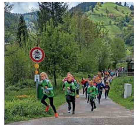
1000m-Lauf mit einem Blitzstart überraschten die Britzinger Kids (grüne Trikots) und führten das Läuferfeld in den Anstieg

Für die Kleinsten galt es 400 m zu absolvieren, die 8 bis 12-jährigen mussten 1000 m und die älteren Schülerinnen und Schüler 2000 m bewältigen. Die Erwachsenen rannten auf der wunderschönen Panoramastrecke 10 km und hatten dabei noch 230 Höhenmeter zu meistern.