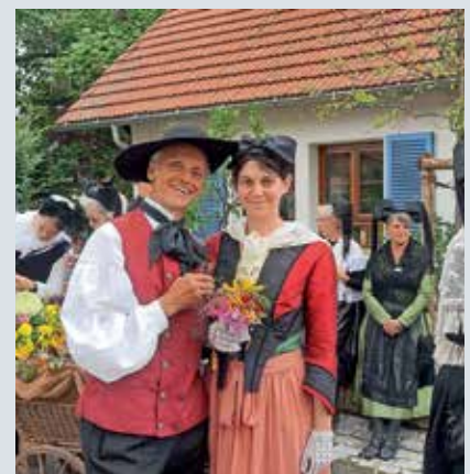
Trachtengruppe Hügelsheim

Kontakt: Trachtengruppe Hügelsheim; y.dusi@web.de