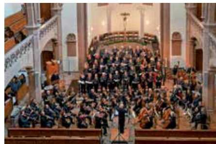
Kammerchor Müllheim mit Orchester

Seit seiner Uraufführung im Jahr 1996 in Buenos Aires trat die Tango-Messe einen Siegeszug um die Welt an, im Jahr 2013 auch mit einem Konzert in Rom zu Ehren von Papst Franziskus sowie mehrmals in der Carnegie Hall, New York City.