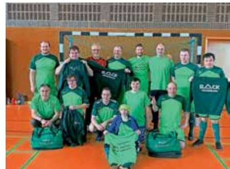
unsere IL-Mannschaft präsentiert stolz unsere Sponsoren.

Wir möchten uns von ganzem Herzen bei unseren Sponsoren für ihre großzügige Unterstützung bedanken. Dank der großzügigen Zuwendungen und dem Engagement konnten wir in der Inklusionsliga und in allen Wettbewerben darum, inklusive Training, teilnehmen.