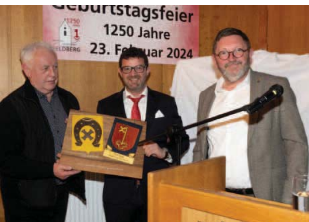
Präsent der Delegation aus dem befreundeten Issenheim.