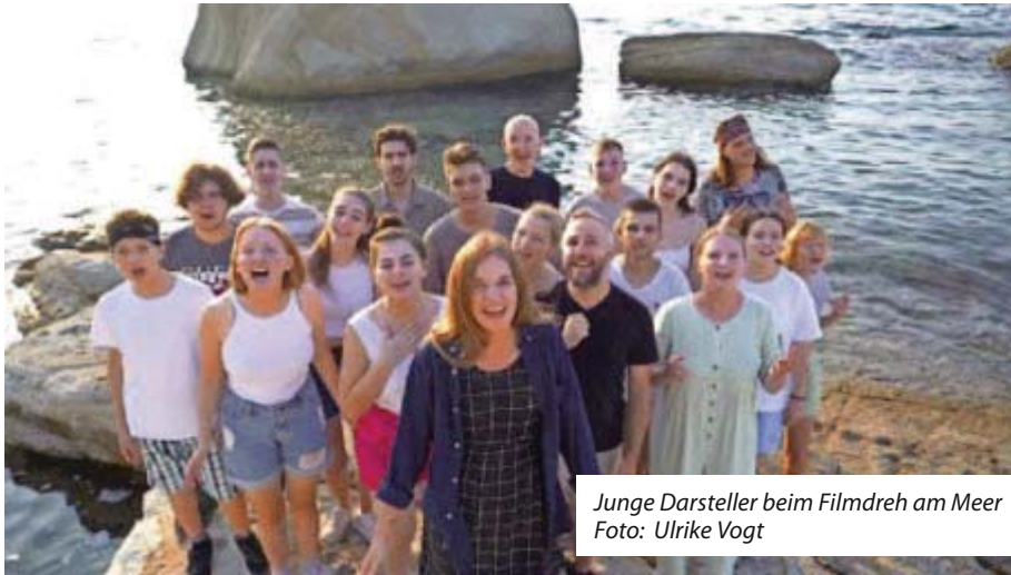
Junge Darsteller beim Filmdreh am Meer

Wer Interesse an einer Teilnahme an dem Friedenscamp hat, kann über die Homepage Kontakt aufnehmen.