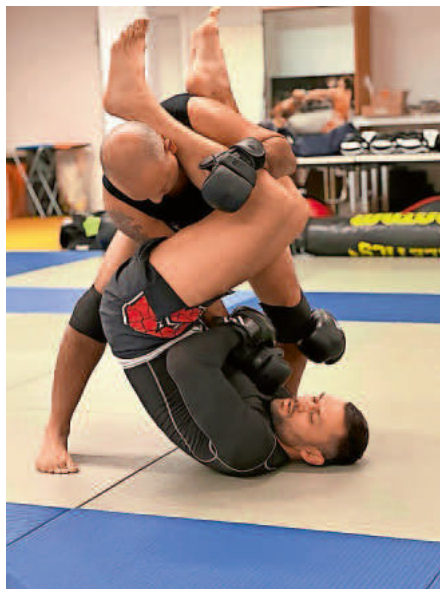
Festhalte Technik aus den Brasilien Jiu Jitsu

BJJ (Brazilian Jiu-Jitsu) ist eine grappling-basierte Kampfkunst und Selbstverteidigungssystem, welche/welches zum Ziel hat den Kampf zu beenden, indem man den Angreifer zur Aufgabe zwingt. Das wird erreicht, indem man Druck auf Gelenke, Muskeln oder Knochen ausübt oder ihn würgt. Infos. unter tammazla.de oder direkt beim Trainer Waldemar Stepanov unter: 017624816974.