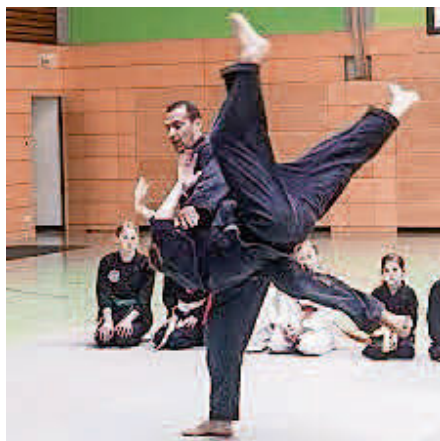
Wurftechnik aus dem Jiu Jitsu

Das Training findet im Kampfkunstzentrum in der Wilhelmstraße 19a, und in der Sporthalle 2, Bismarkstrasse 10 in Müllheim statt. Weitere Informationen, auch zu den Trainingszeiten auf www.tammazla.de .