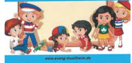
Kinderkirche Vögisheim