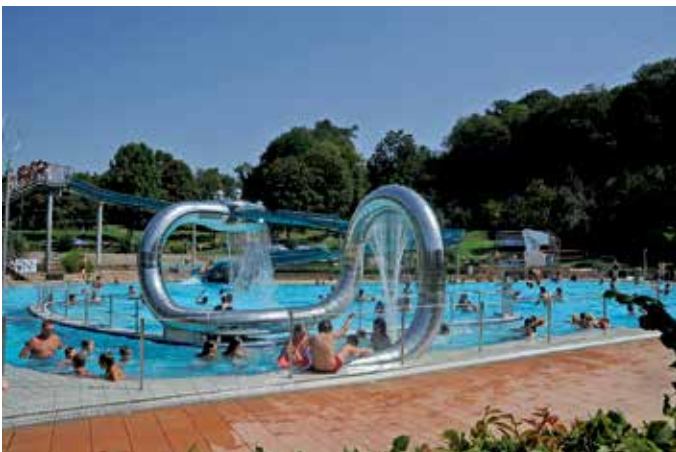
Das Müllheimer Familien- und Freizeitbad wird für 2,66 Millionen Euro netto saniert.