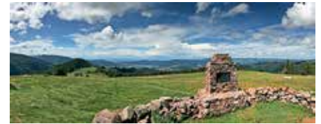
Atemberaubender Ausblick vom Hinterwaldkopf

Das Vorstands- und Übungsleiterteam der Ski-Zunft freut sich über rege Beteiligung. Unterstützungsinteressierte Übungsleiter oder Anwärter dürfen sich für jeden Bereich bei der Geschäftsstelle melden.