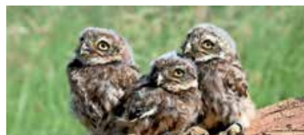
Steinkäuze bei der Beringung

Die Steinkäuze sind wie in den letzten Jahren auch dieses Jahr wieder der Gemarkung Müllheim treu geblieben. Es gab wieder mehrere Bruten und Brutversuche auf verschiedenen Streuobstwiesen. Auf Müllheimer Gemarkung konnten wie fast jedes Jahr wieder an einem Brutplatz 3 Jungvögel beringt werden, und auf Hügeler Gebiet waren es an einem Brutplatz 4 Jungvögel. Leider ist das Gebiet rund um Feldberg seit 2 Jahren nicht mehr Brutgebiet des Steinkauzes, der derzeit auch im gesamten Eggener Tal nicht mehr brütet.