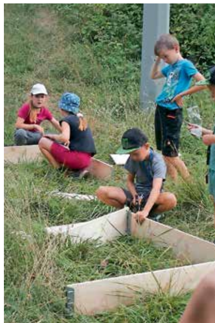
Schüler bei der Arbeit im Schulgarten

Es wurde geklettert, Radtouren durchs Markgräflerland unternommen, Theater gespielt, getanzt, gesägt, geschliffen, gebastelt, gegärtnert, gebacken, Ausflüge unternommen und natürlich ganz viel gelacht, entdeckt und ausprobiert.