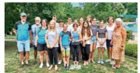
Mannschaft SG Badenweiler-Neuenburg

Nach vier Jahren und pandemiebedingter Pause fanden am 08. Juli erneut die Sportkreismeisterschaften Breisgau-Hochschwarzwald auf der Langbahn im Freibad Müllheim statt. Dieser Wettkampf positioniert sich als wichtiger Einstieg in den Leistungssport für den regionalen Nachwuchs. Insgesamt fast einhundert Schwimmer und Schwimmerinnen traten in verschiedenen Kurzstreckendisziplinen gegeneinander an.