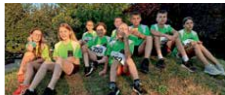
Verdiente Pause nach dem Biengener Schülerlauf