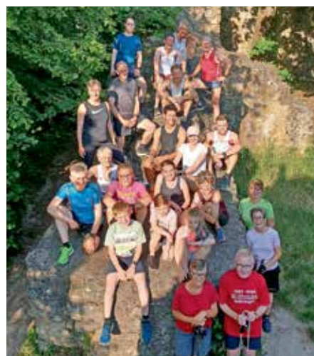
Finisherfoto nach dem Neuenfelslauf in der Burg- ruine