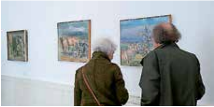
Die Ausstellung „Ausblicke“ ist bis zum 17. September zu sehen.

Die Ausstellung zeigt wichtige Zugänge der letzten Jahre, darunter Werke namhafter Künstler, die weit über die Region hinaus, manche sogar international, einen besonderen Ruf genießen und mit ihren Werken maßgeblich zum Profil des Museums für regionale bildende Kunst beitragen.