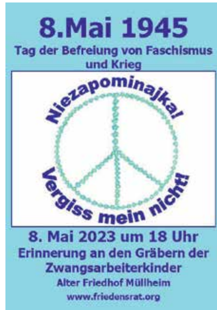
8. Mai: Tag der Befreiung von Krieg und Faschismus

http://www.friedensrat.org/pages/aktionen/2023/8-mai-tag-der-befreiung-von-faschismus-und-krieg.php