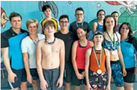
Schwimmer & Trainer der SG Badenweiler-Neuenburg

Alle Mitglieder der Schwimmabteilung des TV Neuenburg sowie die Eltern der Schwimmer sind herzlich zur diesjährigen Abteilungsversammlung eingeladen. Sie findet am Freitag, den 31.03.2023 im Vereinsheim des TV Neuenburg statt und beginnt um 19:00 Uhr. Die Abteilungsleitung freut sich auf eine rege Teilnahme und bittet darum, ergänzende Wünsche und Anträge zur Tagesordnung bis zum 24.03.2023 schriftlich einzureichen.