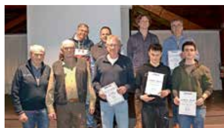
Alle Geehrten im Überblick

Der Vorstand Arno Breitenfeld beendete die Versammlung, bedankte sich für den guten Verlauf und wünschte allen eine gute und vor allem unfallfreie Saison 2023.