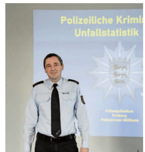
Der Leiter des Polizeireviers Müllheim, Polizeiberrat Thomas Müller, verwies auf Besonderheiten durch die Corona-Pandemie.

Jugendlichen auffängt, ihnen eine sinnvolle Freizeitbeschäftigung ermöglicht und als Ansprechpartner zur Seite steht“, bedankt sich der Polizeichef bei der Stadt. Wieder auf das Niveau der Vor-Corona-Zeit zugenommen haben die Rohheitsdelikte mit 204 Fällen im vergangenen Jahr, obwohl es weder Faschnachtsveranstaltungen noch das Stadtfest gegeben hatte. Deutlich gesunken sind