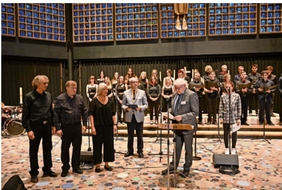
Die Initiatoren von „Musik für den Frieden“ freuen sich über den Göttinger Friedenspreis 2022.