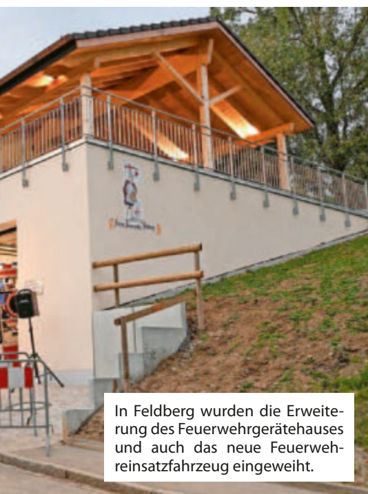
In Feldberg wurden die Erweiterung des Feuerwehrgerätehauses und auch das neue Feuerwehrinsatzfahrzeug eingeweiht.