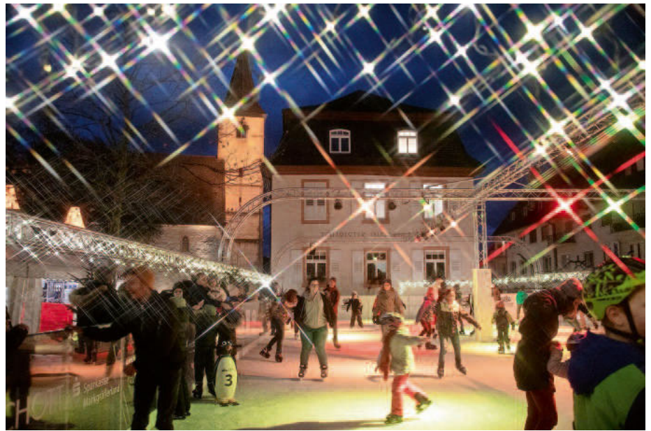
Die Eisbahn in der Vorweihnachtszeit kann kommen. Der Gemeinderat erteilte jetzt seine Zustimmung für dieses Event.

Der Antrag der CDU-Stadtratsfraktion, die Eisbahn wie bisher zu realisieren, und ein weiterer Antrag der Fraktion ALM/GRÜNE, den Einsatz einer weitgehend energieneutralen Kunststoff-Eisbahn zu prüfen, löste