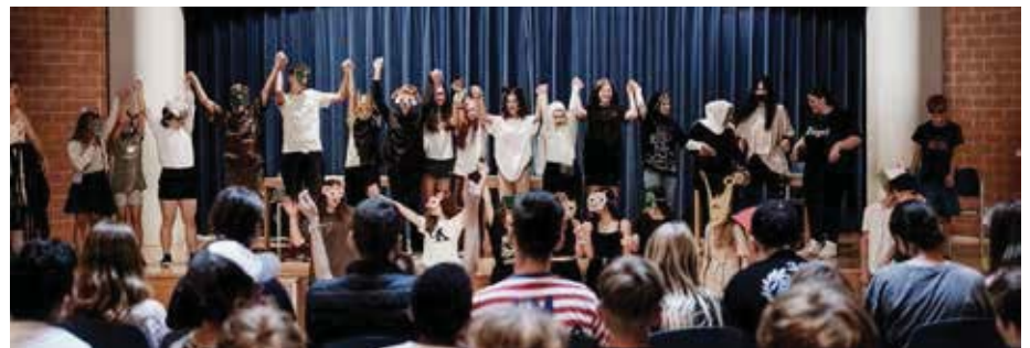
Die Schulgemeinschaft der GMS

neuen Fahrradabstellplatzes wurde neu gestrichen und es wurde damit begonnen, Bilder an die Wand anzubringen. Das Theaterprojekt hat eine witzige und tiefgreifende Aufführung für die Schüler aufgeführt. Besonders hervorzuheben ist auch die Projektgruppe um die Lehrer Seitz und Held, die mit ihren Schülern an den heißesten Tagen des Jahres in brennender Sonne auf dem Sportplatz das Grün entfernt haben und mit Asphaltfarbe die Markierungen der einzelnen Sportarten wieder neu aufgebracht haben. Für das leibliche Wohl aller Beteiligten sorgte das Küchenteam mit liebevoll gemachtem, leckerem Fingerfood.