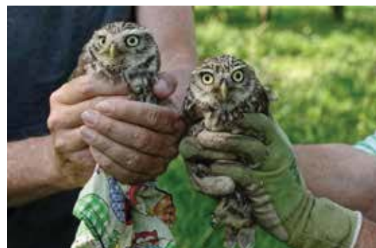
Steinkäuze bei der Beringung

Hoffen wir, dass uns dank der tatkräftigen Mitarbeit zahlreicher NABU-Mitglieder bei der Betreuung der Steinkauz-Brutröhren diese hübsche und nützliche kleine Eule weiterhin erhalten bleibt und so zur Biodiversität in unserer Region beiträgt.